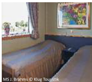
MS J. Brahms