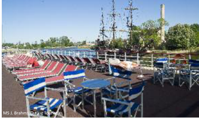
MS J. Brahms