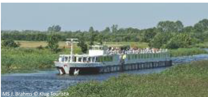
MS J. Brahms