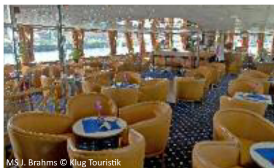
MS J. Brahms

Noch in der Nacht hat unser schwimmendes Hotel Hamburg verlassen und strebt am Vormittag auf der Elbe dem reizvollen Städtchen Lauenburg entgegen. Am Nachmittag startet von Lauenburg ein Busausflug in den Naturpark Lüneburger Heide und damit in eine der ältesten Kulturlandschaften Deutschlands. In Dömitz treffen wir wieder auf die MS Johannes Brahms. Nach dem Bord-Abendessen geht es zur nahen Festung Dömitz , wo das Ensemble Recercada mit Musik aus Mittelalter und Renaissance auf seltenen alten Instrumenten den Geist vergangener Zeiten zu neuem Leben erweckt.