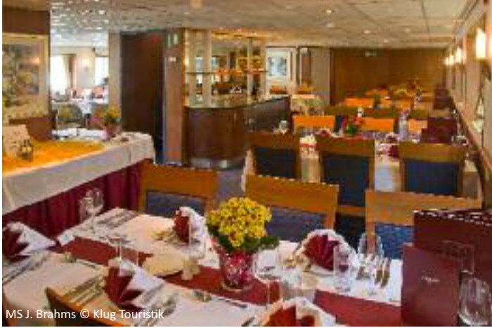
MS J. Brahms