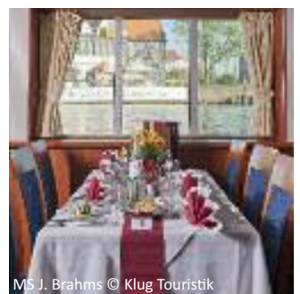
MS J. Brahms