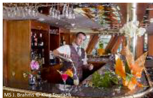
MS J. Brahms